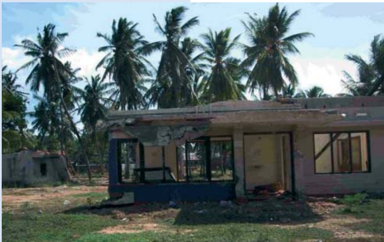
Reconstrucción de centro comunitario de Galle